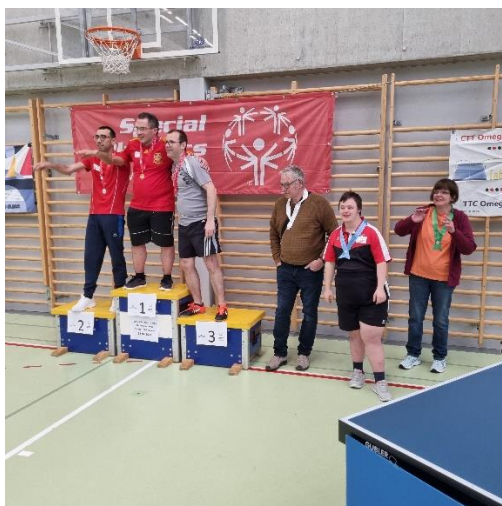
Le podium du groupe 6