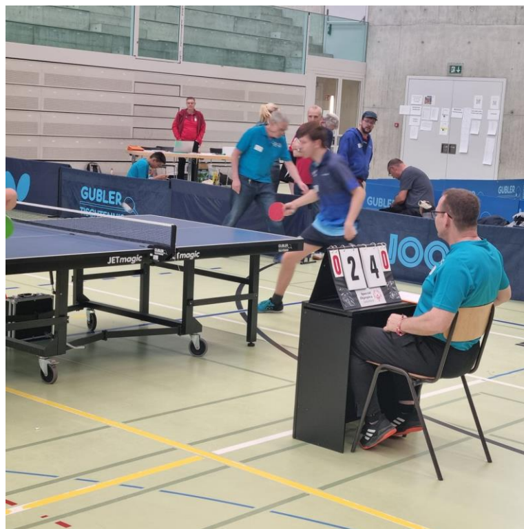
Les arbitres doivent rester concentré, cela va vite

Le plaisir des participants à affronter à chaque fois de nouveaux adversaires est évident. Dans l'ensemble, il y a peu de surprises et si l'on excepte les 2 joueurs de Lausanne. Les évaluations de niveau des joueurs effectuées par les coaches se révèlent de bonnes qualités. Le matin nous pouvons faire 7 tours complets de divisioning avant de pouvoir passer à table.