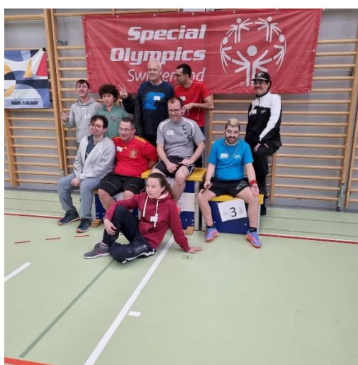
Les Lausannois en nombre