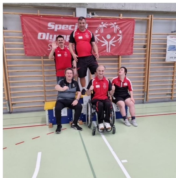
Nos amis d'Autriche prêts à en découdre pour les médailles

Nous utilisons le classement du divisioning, sans faire de changement, pour former des groupes de 5, sauf pour le groupe 6 où 6 athlètes s'affronteront pour les médailles.