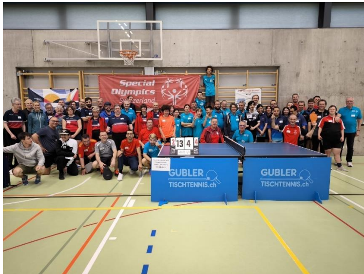
Tout le monde réuni pour la photo de famille