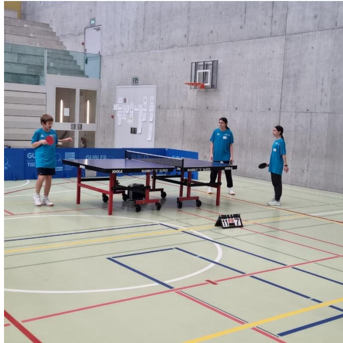
Les compteurs de points ont profité de chaque instant libre pour jouer