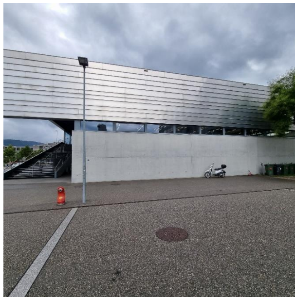
La salle de l'Esplanade

L'expérience des World Games avec le divisioning fait par le système Suisse, plutôt que par une table des rois, m'avait intéressé et m'a persuadé que ce système était plus intéressant pour les joueurs et aussi plus juste. Il permet d'éviter à un joueur d'affronter de multiples fois le même adversaire. En revanche, il demande un plus grand nombre de tables et aussi une organisation un peu plus complexe. Il faut aussi avoir un système qui permet de générer les matches en fonction des résultats de chaque tour de divisioning. Special Olympics utilise déjà un logiciel pour générer ces matches pour tous les sports où cela est nécessaire. Le Sport Delegate du tennis de table, Olivier Jaunin, et moi avons suivi un cours à Ittigen pour l'utilisation de ce logiciel. Malheureusement celui-ci n'intègre aucune fonction pour gérer le tournoi et est compliqué et peu intuitif. Je contacte donc Frank Squillaci, dont j'utilise le programme de gestion de tournoi de tennis de table depuis de nombreuses années, pour voir s'il est possible de trouver une solution. Il me dit que l'intégration d'un système Suisse pour faire le divisioning n'est pas un problème ! Nous voilà lancé pour une nouvelle aventure et nous espérons que l'intérêt pour ce tournoi sera aussi important qu'en 2023.