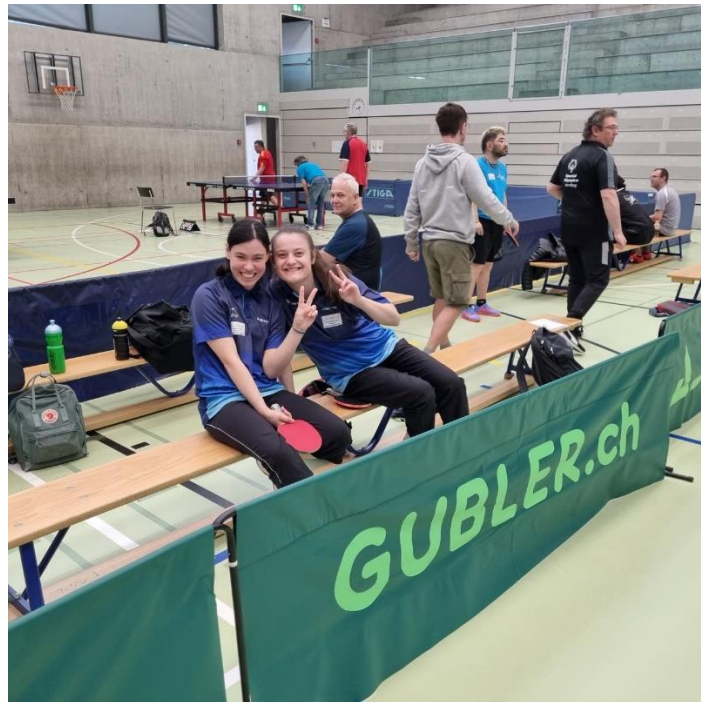
Il n'y a pas que les points gagnés qui comptent