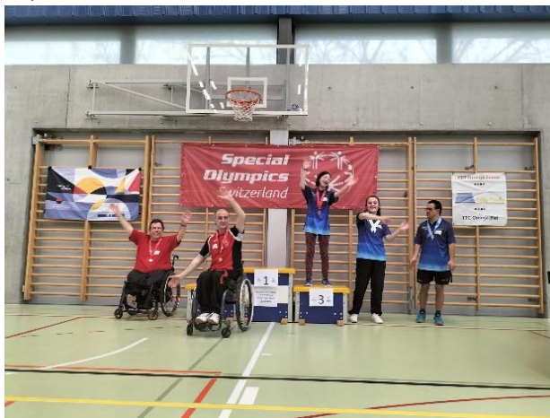
Le podium du groupe 5