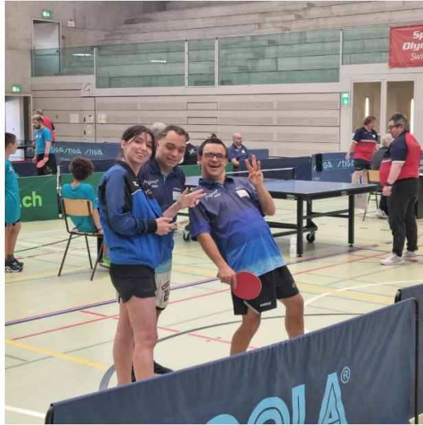
Bonne humeur au programme