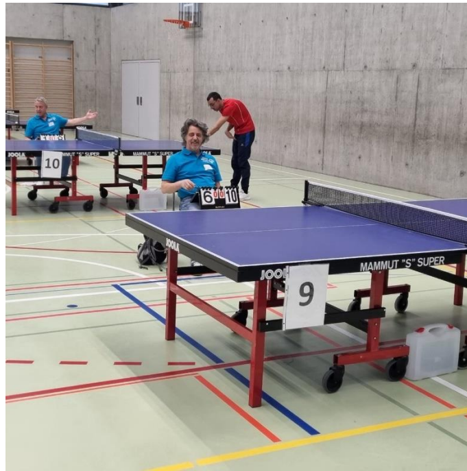
La reprise après le repas, avec le sourire, même pour les arbitres