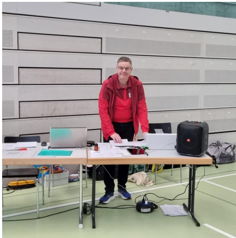
Le directeur du tournoi, avant le lancement des hostilités