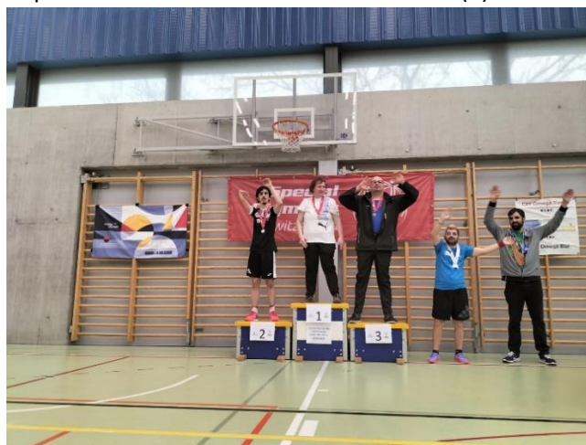
Le podium du groupe 2