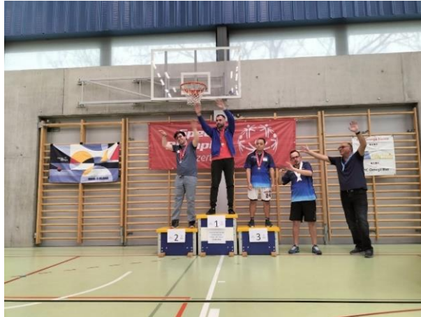
Le podium du groupe 1