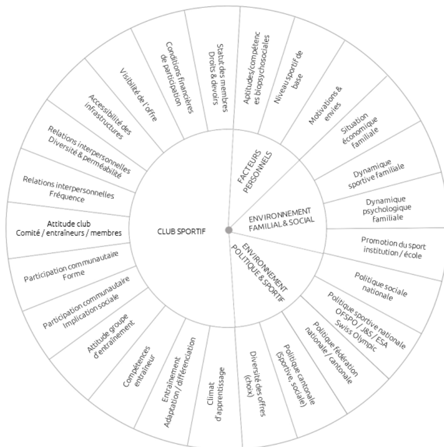
Fig. 1: roue de l'inclusion – facteurs déterminants pour le processus d'inclusion

Le programme Unified a permis de développer des mesures visant à accompagner les clubs sur la voie de l'inclusion. Au sein d'une société complexe, les clubs sportifs constituent de petites communautés qui mettent en œuvre le processus d'inclusion. Plusieurs facteurs agissent simultanément sur les clubs et les processus. Ces facteurs peuvent être répartis en quatre niveaux d'intervention : le club sportif, l'environnement politique et sportif, l'environnement familial et social et, enfin, le niveau de l'individu. C'est au niveau du « club sportif » qu'un Unified Club peut exercer une influence en concevant et en aménageant ce domaine pour qu'il soit inclusif.